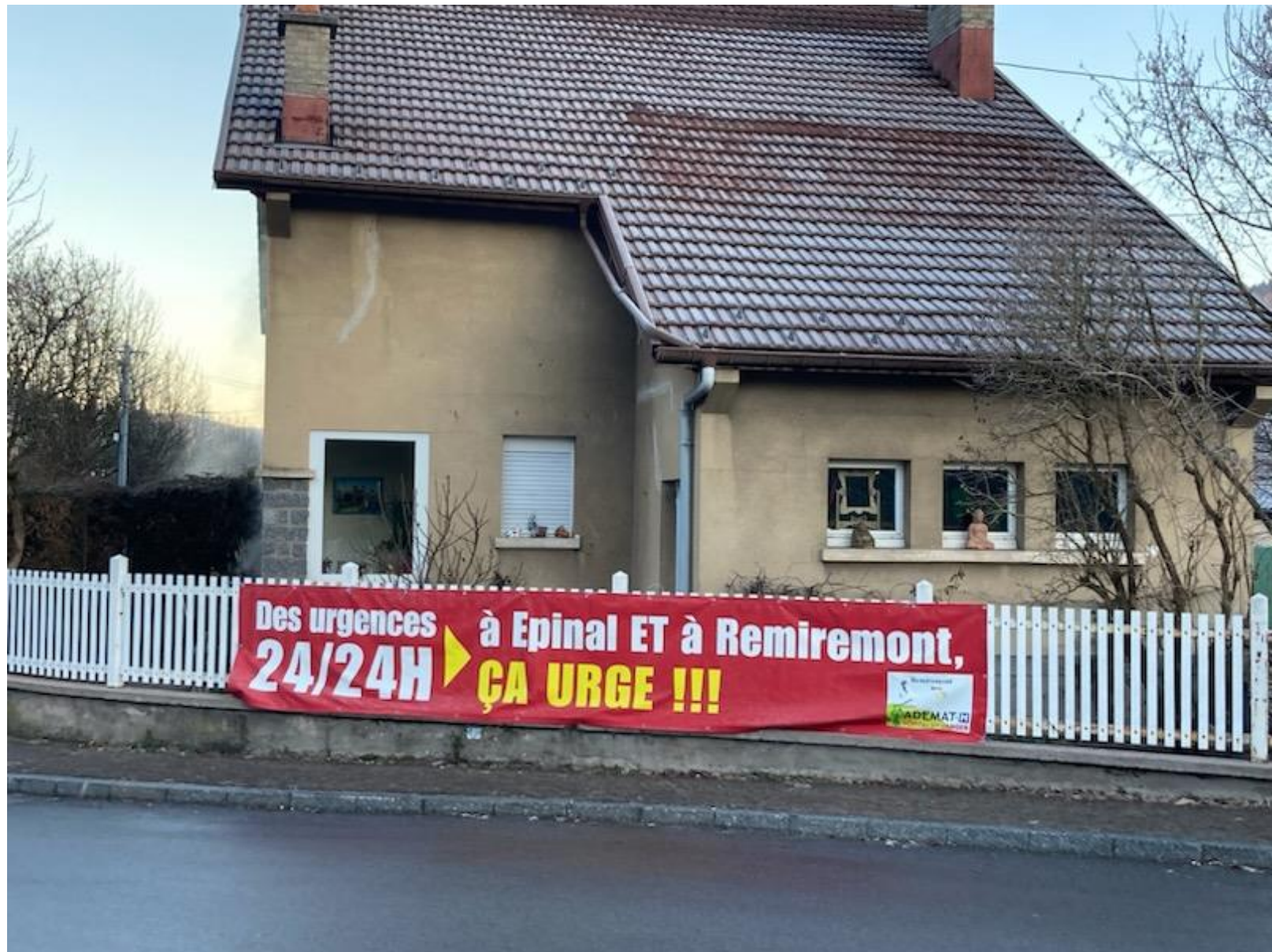
Rond point de l'octroi Remiremont