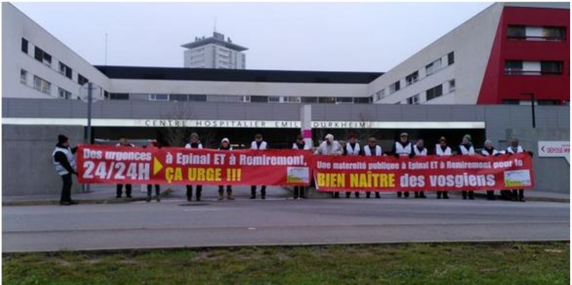
Opération banderoles à Epinal et Remiremont Banderoles enlevées dans la journée